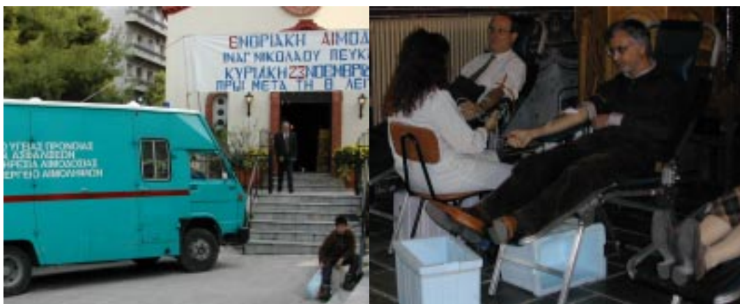
Φωτογραφικὰ στιγμιότυπα ἀπὸ τὴν αἰμοδοσία τῆς 23 Νοεμβρίου 2003.

Ἦδη ἔχουμε προγραμματίσει τὶς αἰμοδοσίες τοῦ ἔτους 2004 γιὰ τὶς 2 Μαΐου καὶ τὶς 31 Ὀκτωβρίου. Περιμένουμε καὶ σ' αὐτὲς τὴν ὀλοπρόθυμη συμμετοχή σας.