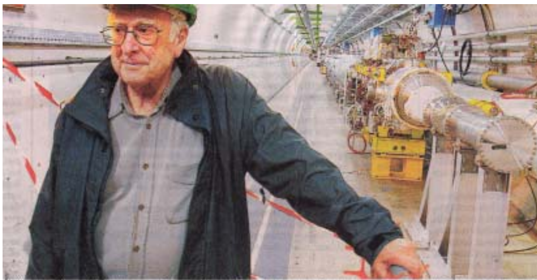
Ο Βρετανός κολλητής Πίτερ Χίγκες επισκέφθηκε τον Μεγάλο Επιταχυντή Αδρυνίων δειλώνοντας την πατη του ότι πολύ σύντομα οι επιστήμονες θα εντοπίσουν το μισπηράδες σωματίδιο (ή «σωματίδιο του Θεού») που θα ελιγίσει την ύπαρξη της ύλης στη μάσα. Το σωματίδιο έλαβε το όνομα του βρετανού επιστήμονα, αφού ήταν ο πρώτος που μίλησε γι' αυτό

πότητας. Τό συνολικό βάρος του έπιταχυντή άγγίζει τούς 9.000 τόνους κái τό κεντρικό κομμάτι του περιέχει περισσότερο σίδηρο άπό όσο χρειάστηκε γιά νά κατασκευαστεί ό Πύργος του ΞΑίφελ (βλέπε έφημ. ΤΑ ΝΕΑ, 20-4-2008, σελ.77)!